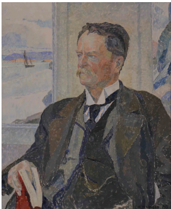
Рис. 1. Доктор Яльмар Тэль. Портрет работы Карла Вильгельмсона, 1913 г.

Тэль вместе с Разнотовским 14 сентября отправился в Кореповское на пароходе Сотникова, согласившегося безвозмездно доставить товары в Енисейск [17. Л. 45 об.]. Но уже 16 октября пароход повернул обратно, дойдя только до о. Охотского. Из-за ранней зимы река начала замерзать, и было решено возвращаться в Енисейск. Пристав расстался с Тэлем в Туруханске, поручив заботу о нем судостроителю П.А. Бойлингу и выдав ученому открытое предписание, «чтобы ему во время пути оказывали должное содействие» [17. Л. 45 об.].